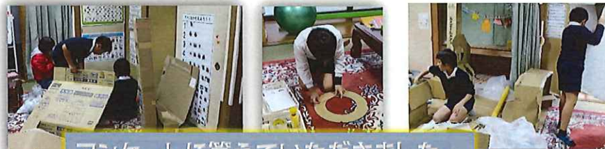
アンケートに答えていただきました。

「て・い・く」の庭にある白梅ようやく真っ白い花が咲きました。最近、毎日のように小鳥やミツバチが集まり、春の訪れを知らせます。12月にいただいたさくら草も赤や白の小さな花が咲き誇り、陽春の日差しにまぶしく輝いています。