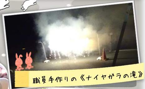
職員手作りの《ナイヤガラの滝》