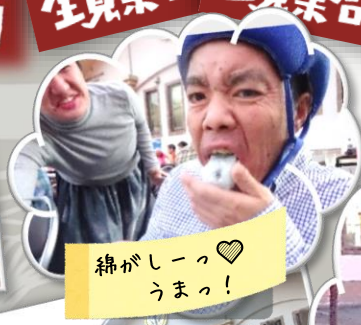
綿がしーっ♡ うまっ！