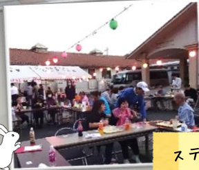
ステージを観覧中(^)/