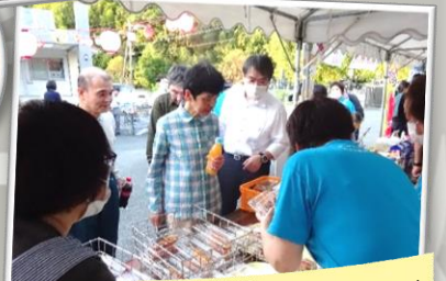
おなかついた！焼きそばにしよう！