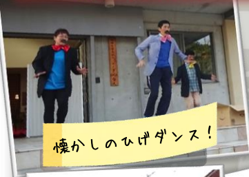
懐かしのひげダンス！