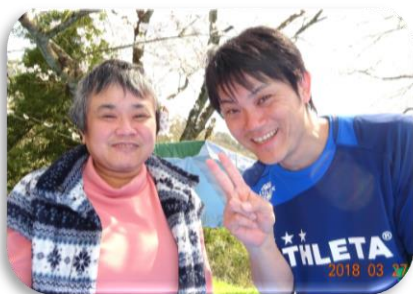
近くの公園でお花見