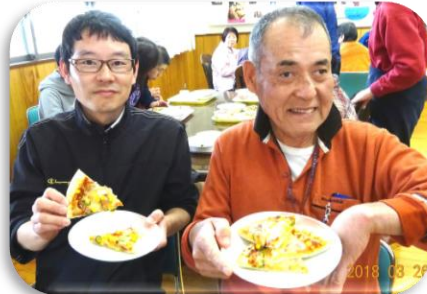
今日の昼食はピザ！！