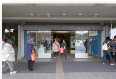
国際会館 正面玄関