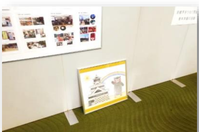
作品はとても少ない