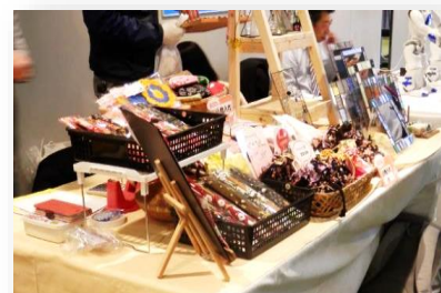
販売は育成会の事業所が3団体のみ