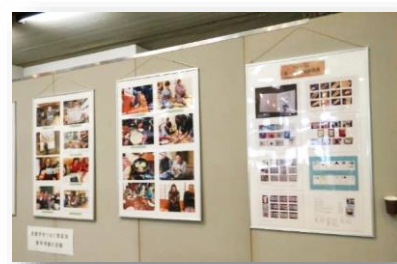
青年教室の紹介パネル