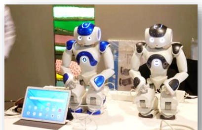
ロボットの展示ブースが3つ