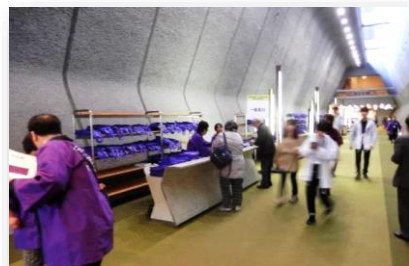
チケットと資料を交換するので、受付の人員は少ない