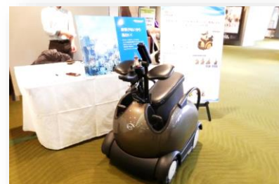
介護用ロボット車イス