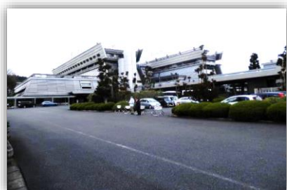
国際会館全景 巨大な会議場