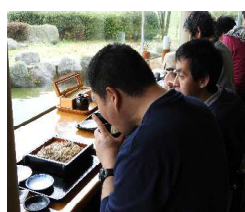
景色を眺めて打ち立てをいただきました