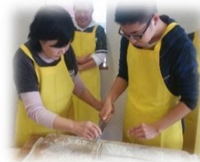
(春の遠足:そば道場)