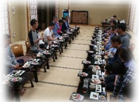
(11フレッシュタイム)