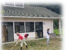
(リサイクル回収作業)