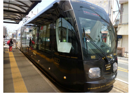
最新型のcocoroにも乗車