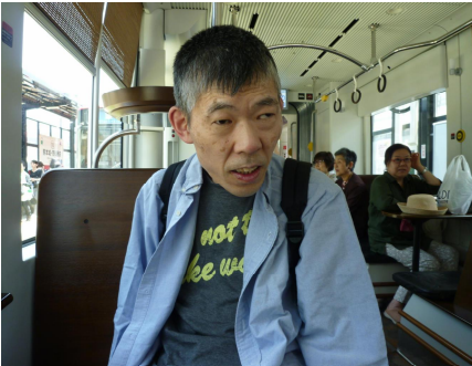
きれいで静かで快適な車内