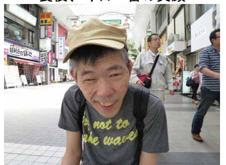
食後、今日一番の笑顔