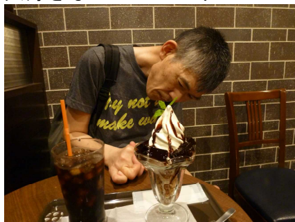
大好きなコーヒーゼリーパフェ