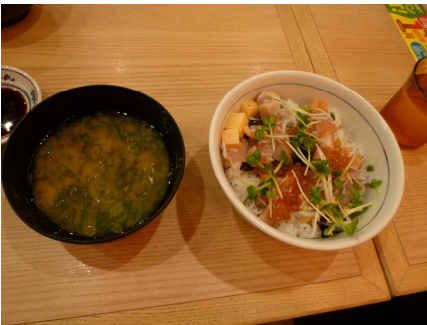
リーズナブルな海鮮丼でした