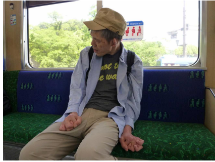
新町から市電に乗車