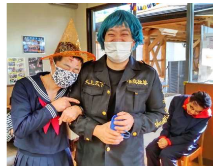
すてきなカップル？