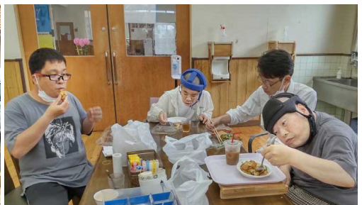
食堂でいただく 「うまい！」