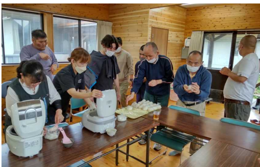
みんなでおにぎりを握る