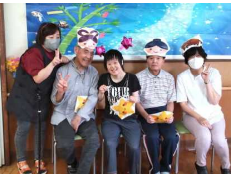
最後に、グループみんなで記念撮影