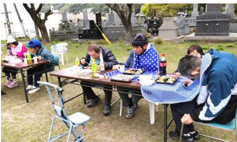
お弁当をいただく