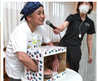
何が入っているかな？