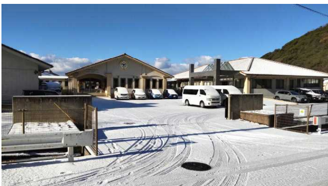
白銀のしょうぶの里