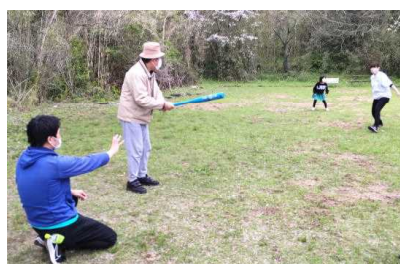
代わる代わる、野球