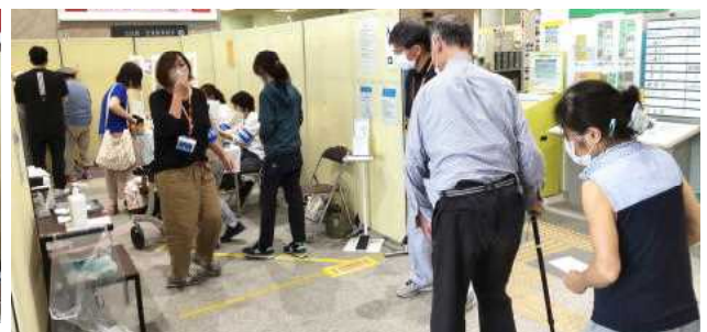
奥で投票用紙に記載