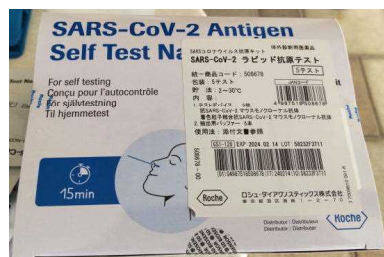
※厚労省が承認した「体外診断用医薬品」で検査します