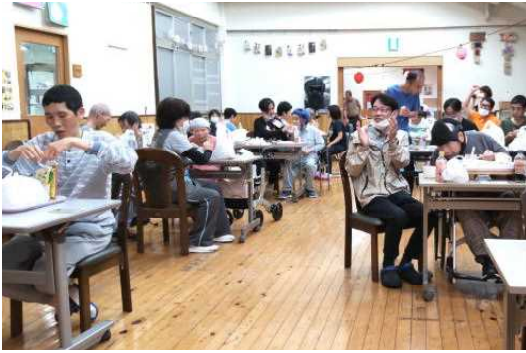
屋台メニューをいただきます