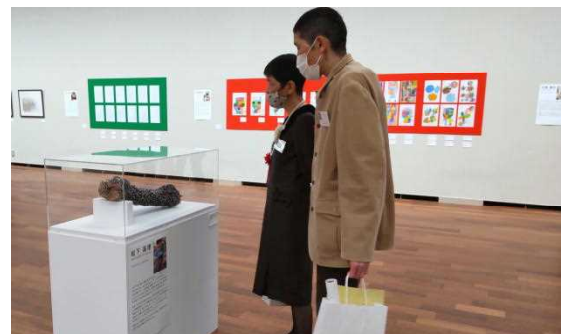
しょうぶの里の利用者さんの作品を見る