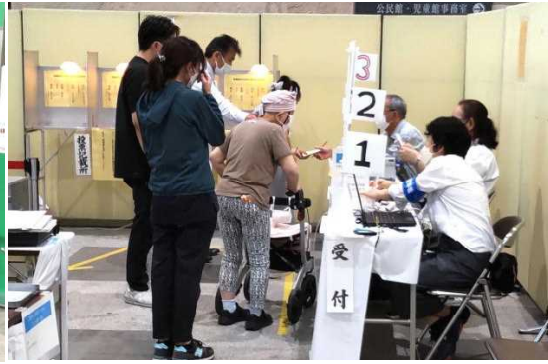
期日前投票 西区役所