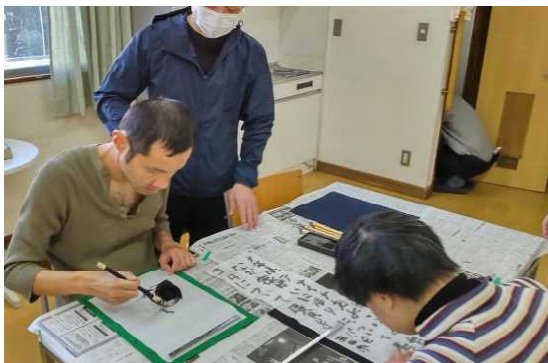
利用者さんの書き初め