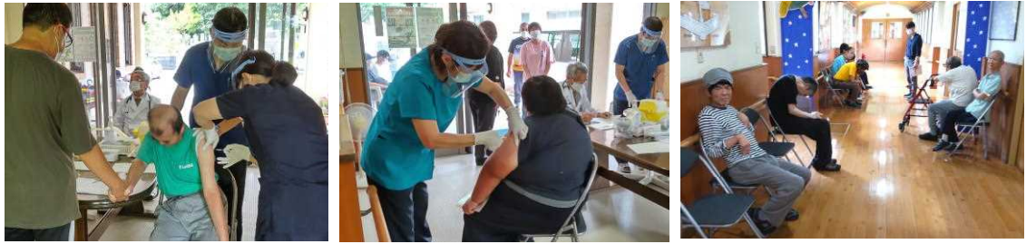
接種後、15分間様子を見ます