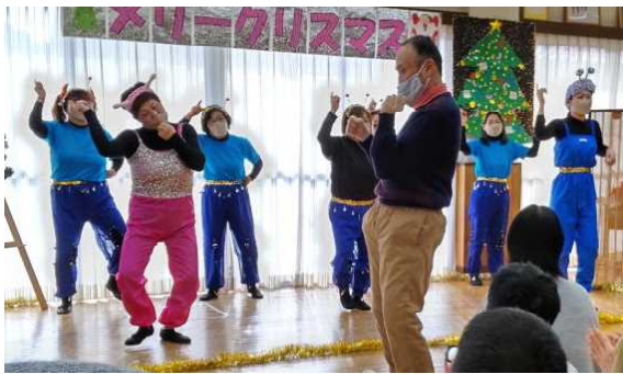
給食職員のピンクレディ