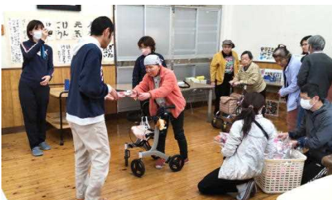
プレゼント渡し(入所)