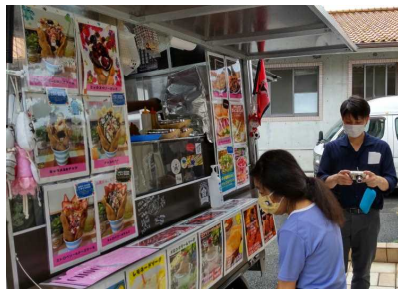
いろいろなメニュー