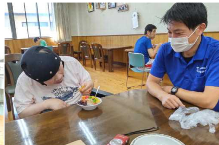
手作りの白クマ うまい！