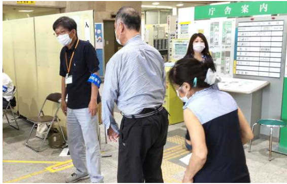
※画像は 参議院選挙の期日前投票 (7/7)