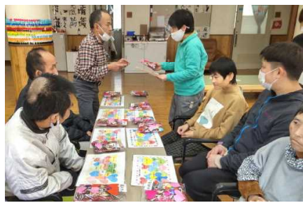
プレゼント渡し(通所)