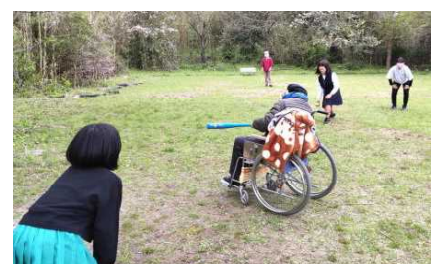
小学生も飛び入り!