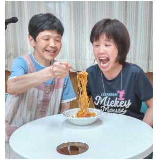
大きな口で早食い競争！