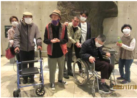
装飾古墳館は下事務長が館長をしていたところです