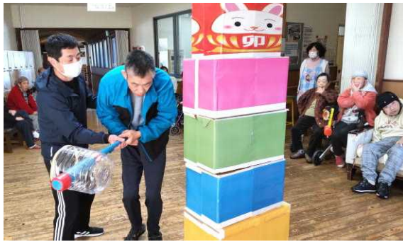
だるま落としゲーム