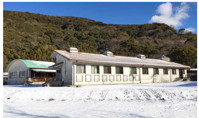
白い雪と青い空、とてもきれいでした