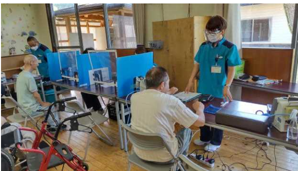
皆さん、慣れたものです