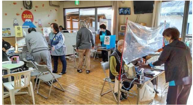
皆さん 落ち着いて受けられていました