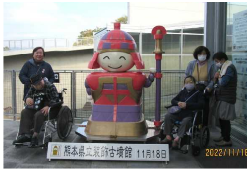
マスコットと記念撮影