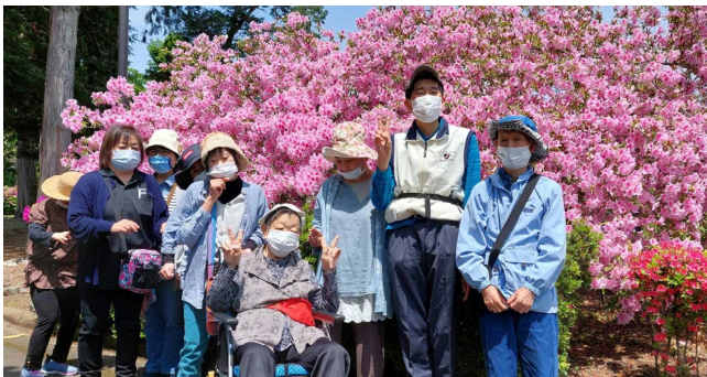
ここは、大津町の昭和公園です