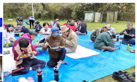
お弁当をいただく