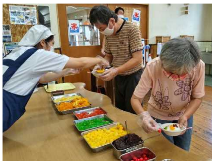
おいしいのができるかな？