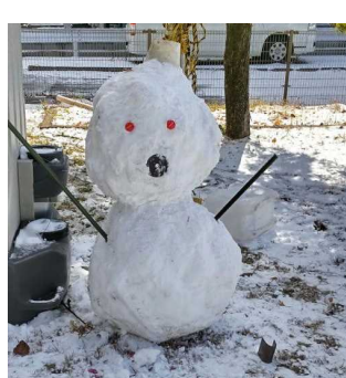
雪だるまも作りました