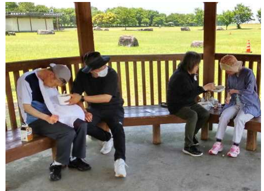
熊本新港公園のあずま屋でいただく