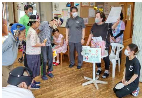
次に、グループでクイズ