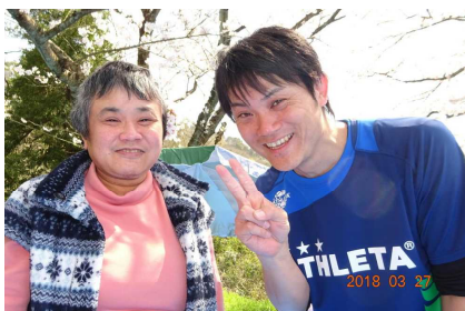
近くの公園でお花見