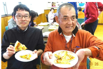
今日の昼食は、ピザ！！